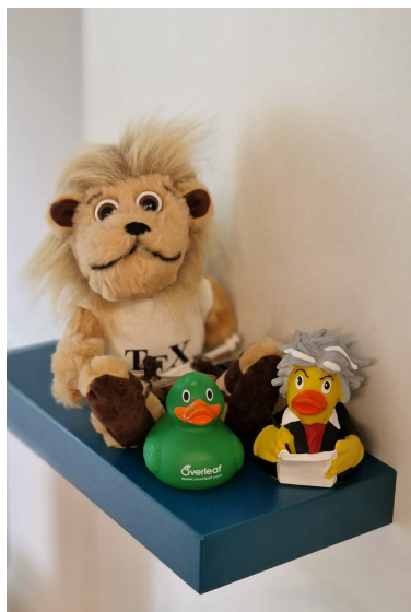
Obrázek 2: TeXoví maskoti