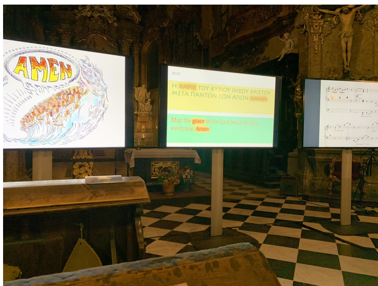
Obrázek 19: 11. 10. 2019 Závěr Fantasie Apocalypitiky: AMEN!