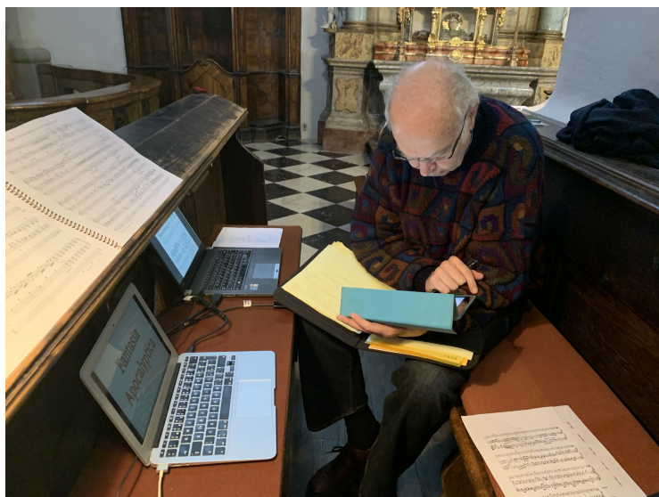
Obrázek 18: 11. 10. 2019 Soustředění před koncertem