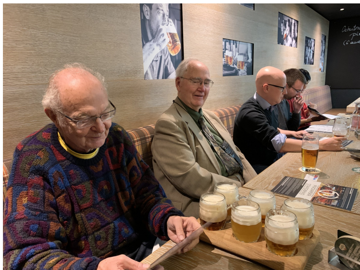
Obrázek 15: S dalším držitelem Turingovy ceny Dana Scottem po jejich přednáškách 9. 10. 2019 v Brně