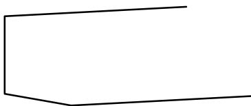
Obr. 2 Hranatý rám

slope = 3; pickup pencircle scaled 1pt; normalpen := savepen;