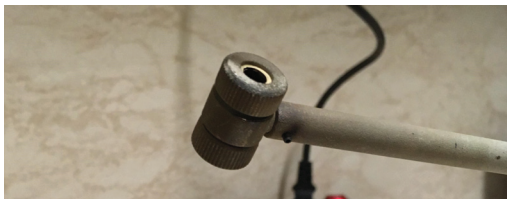
Obr. 2: Dvojitá tunelová sonda

Pro uplatnění obou těchto stabilizací je proto velice žádoucí, aby plazma v tokamacích rotovalo. Abychom v budoucnu tuto rotaci v tokamacích zajistili, je nejdříve potřeba porozumět jevům, které rotaci způsobují a které ji mohou ovlivňovat. S tím nám mohou pomoci diagnostické sondy, jakou je např. dvojitá tunelová sonda zobrazená na obr. 2.