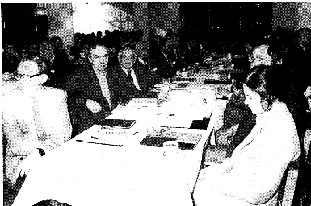
Záběry z pléna konference