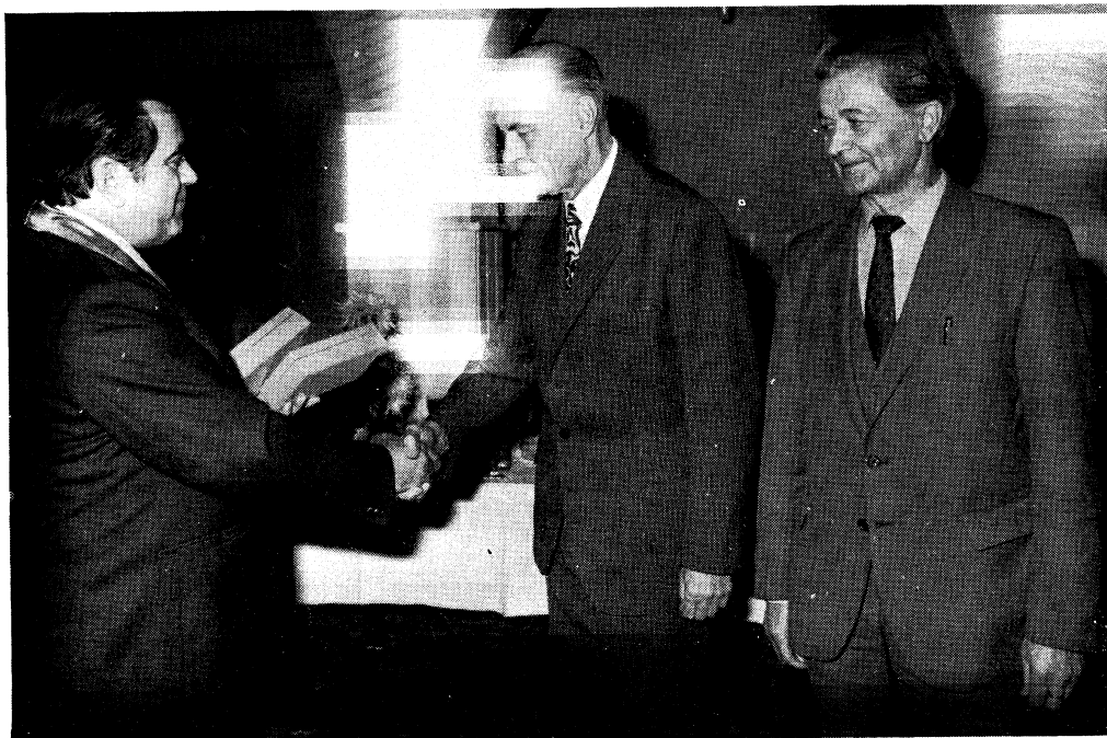
Přijetí na MěNV Gottwaldov Předání symbolických klíčů města Gottwaldova představitelům JČSMF a JSMF