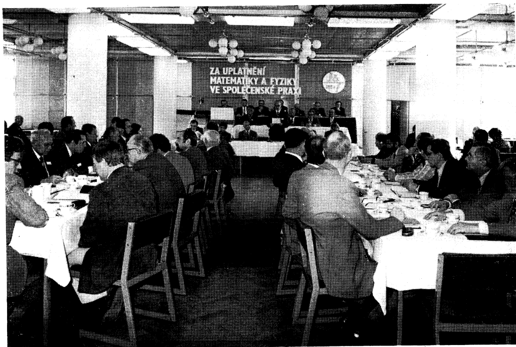
Pohled do jednací síně v prvním dni jednání Hlasování