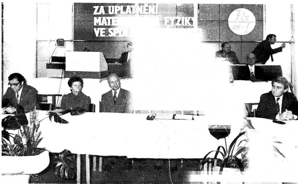
Zahájení sjezdů Zahraniční účastníci sjezdů