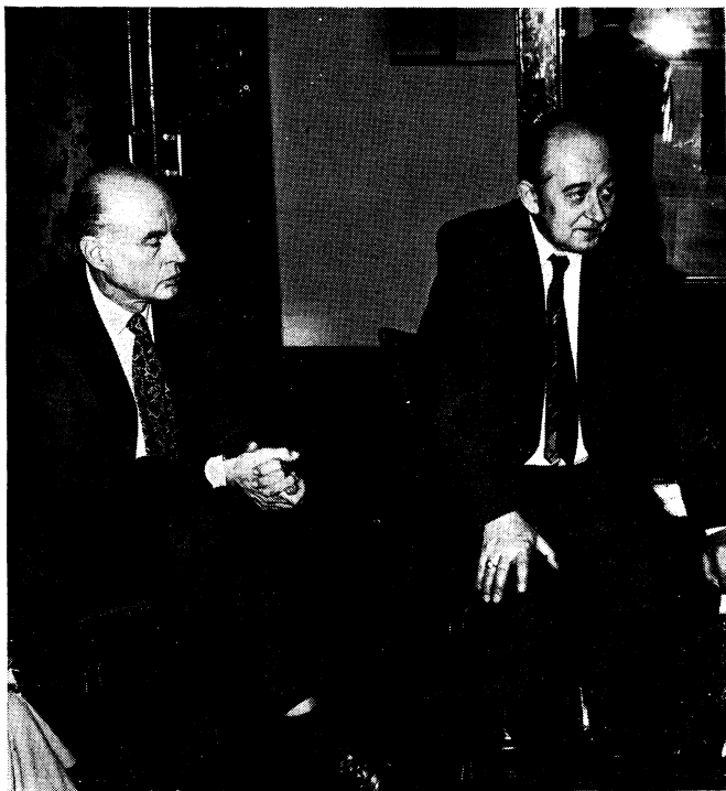
Obr. 1. Ministr školství ČSR při svém projevu