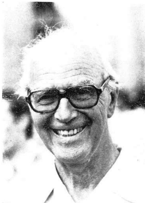
Významný světový matematik G. Choquet z Francie