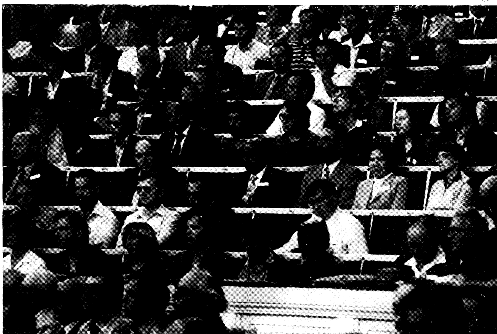
Pohled do kongresového sálu