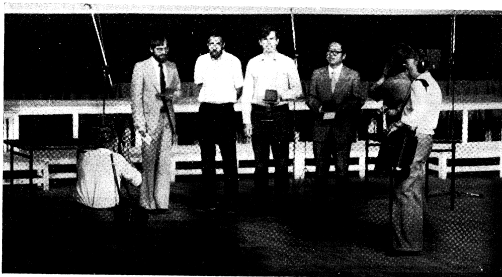
Zleva: R. Tarjan obdržel Nevanlinnovu cenu; A. Connes, W. Thurston a S. T. Yau přejímají Fieldsovy medaile.