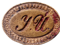
Úlehlovo pečetidlo, mosaz, nedatováno, 20 × 15 mm (zrcadlově převráceno). Archiv Moravského zemského muzea v Brně, fond Josef Úlehla , sign. 41/82, inv. č. Ea-45.