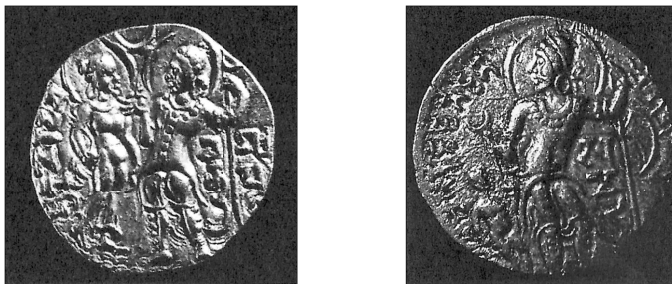
Obr. 1.2: Zlaté mince z doby Čandragupty I. (vlevo) a Samudragupty (vpravo) 24