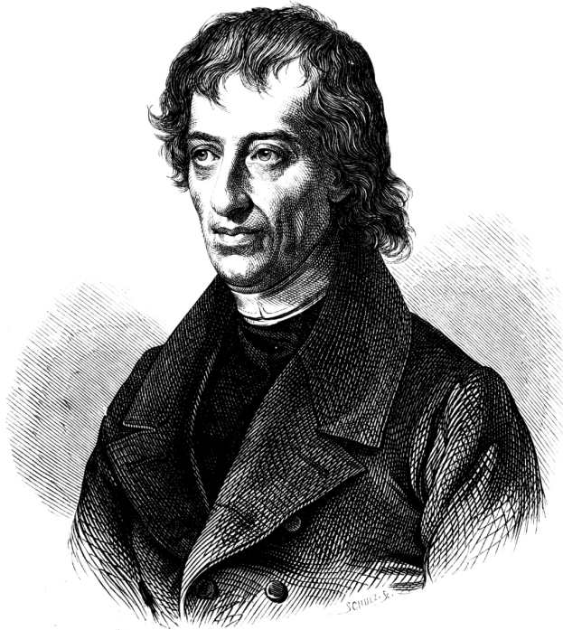
OBR. 2.1 BERNARD BOLZANO