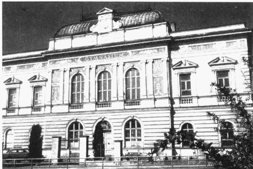
Stará budova klasického gymnázia v Uherském Hradišti