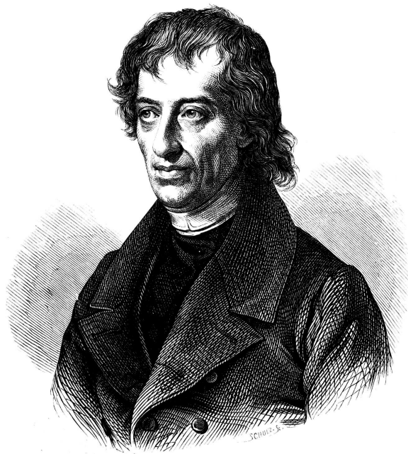
OBR. 5.3 BERNARD BOLZANO