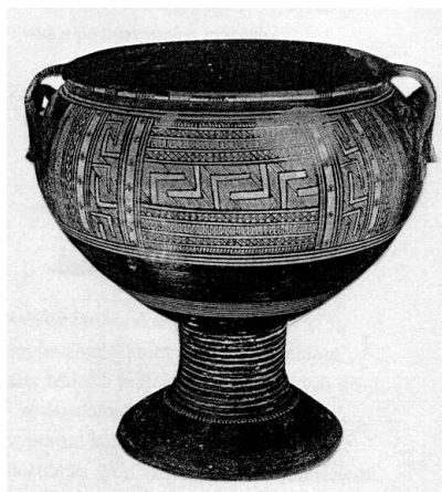
(b) Geometrické ornamenty na keramice, 9. stol. př. Kr.