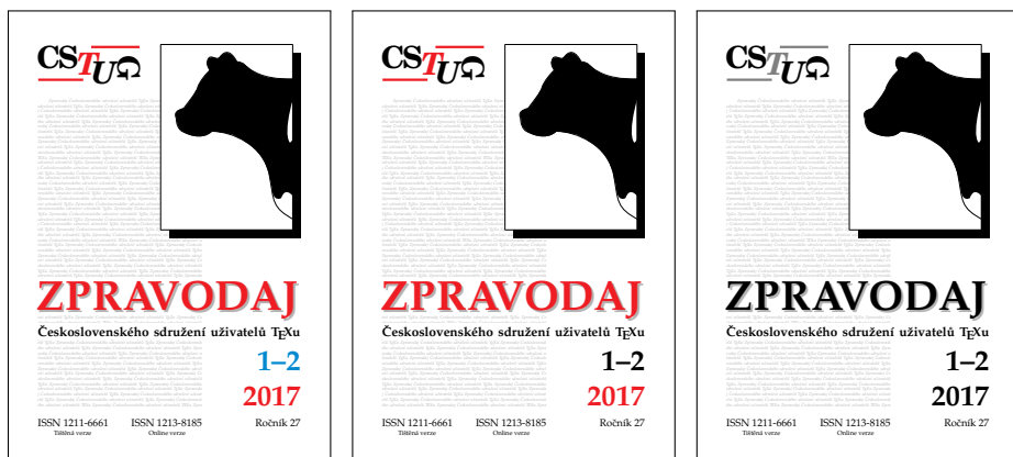
Obrázek 1: Obálka Zpravodaje č.2017/1-2 při zadání volby color (vlevo), twocolor (uprostřed) a žádná (vpravo).

Pro sazbu čísla se používá stejná L A T E Xová dokumentová třída jako pro přípravu článků. Toto autorovi dává příležitost překvapit čtenáře nečekanou obálkou. ☺