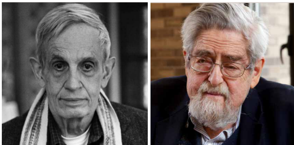
Obr. 1. JOHN F. NASH A LOUIS NIRENBERG