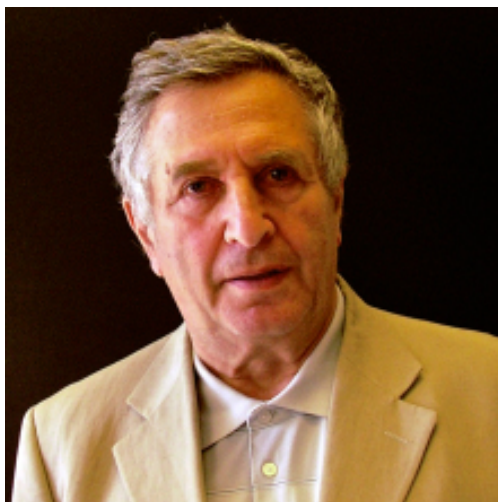
Obr. 1. JAKOV G. SINAJ

V pondělí 19. května 2014 se J. Sinaj nejprve zúčastnil kladení květin a věnců u památníku Nielse Henrika Abela v královské zahradě v Oslu (viz obr. 2). Následující den pak laureát převzal Abelovu cenu v hlavní aule univerzity v Oslu. 1 Je to v pořadí již dvanáctá Abelova cena za matematiku 2 a je spojena s odměnou jednoho milionu amerických dolarů. Dne 21. května J. Sinaj proslovl na univerzitě v Oslu odbornou