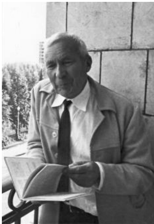
Obr. 5. ANDREJ NIKOLAJEVIČ KOLMOGOROV (1903–1987)

splňuje. Původně existovala hypotéza, že chaotické chování je způsobeno konkávním tvarem vnitřní hranice (viz obr. 3). Pak ale v roce 1979 Leonid Bunimovič [2] dokázal, že pro konvexní kulečnick ve tvaru atletického stadiónu (viz obr. 4) také dostáváme chaotické chování trajektorií.