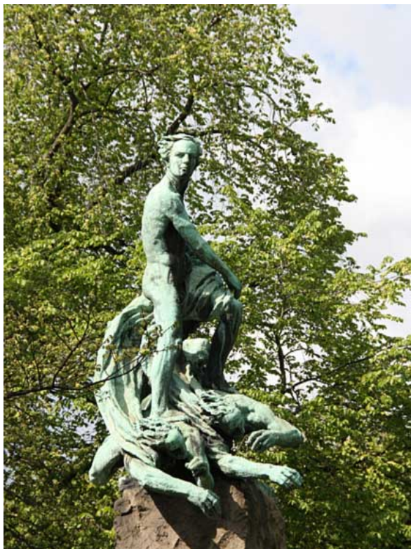
Obr. 2. Socha NIELSE HENRIKA ABELA v Oslu