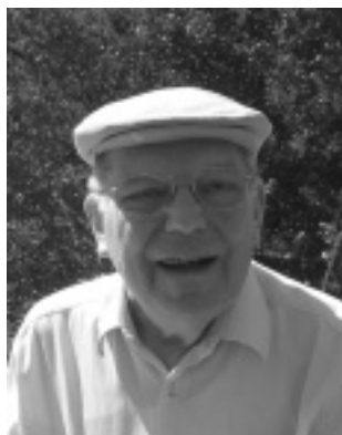
Obr. 1. John Griggs Thompson a Jacques Tits.

J. G. Thompson působí od r. 1993 jako Graduate Research Professor na University of Florida a je emeritním profesorem na Univerzity of Cambridge v Anglii. Narodil se 13. října 1932 v Kansasu. Na slavné Yale University začal studovat teologii. Po roce však přešel na matematiku a udělal dobře. Saunders Mac Lane jej totiž pozval, aby si udělal doktorát na University of Chicago. Zde se začal intenzivně věnovat konečným grupám symetrií a získal v roce 1959 titul Ph.D. Poté rok působil na Institute for Defense Analysis a dva roky na Harvardově univerzitě. Pak se vrátil do Chicaga a v období 1962–1968 zde byl již profesorem. V roce 1970, kdy ještě nedosáhl ani 40 let,