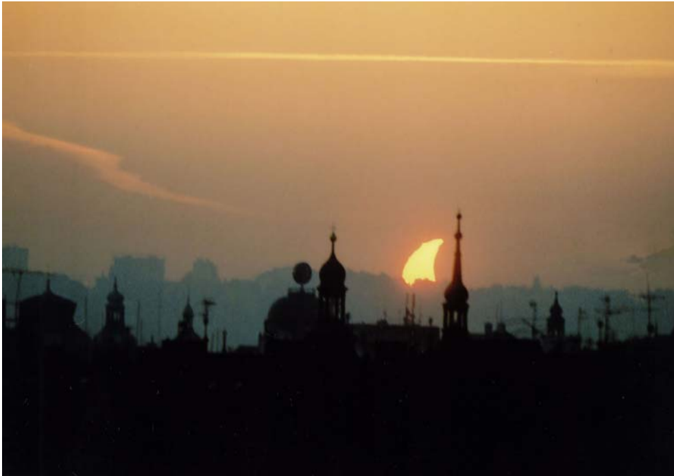
Částečné zatmění Slunce v Praze dne 31. května 2003 ve 4:58 a 5:00 SELČ.