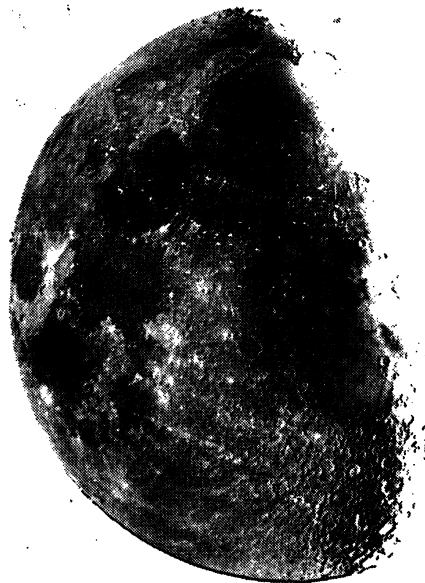
Obr. 6. Táž fotografie, modifikovaná popsanou metodou; pošinutí i jeho azimut jsou patrné z černého kraje. Takto plastické fotografie Měsíce nebylo dosud dosaženo.